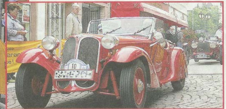
Bürgermeister Leonhard Helm (rechts, mit Hut) gab das Startsignal zur 6. Königstein Classic. 100 Oldtimer gab es auf der Strecke zu bewundern, darunter unter anderem einen Ferrari Dino GT (oberes Bild) und einen BMW 315/2 aus dem Jahr 1934, eines der ältesten Fahrzeuge im Feld (unteres Bild).

Königstein. Was ist da los? Männer mit orange-weißen Schutzwesten sperren die Straße. Bauarbeiten auch am Sonntag? Nein! Es sind die Startvorbereitungen zur 6. Königstein Classic, einem Wertungslauf zum ADAC-Oldtimer-Pokal, organisiert vom ADAC-Ortsclub Königstein.